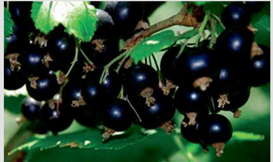
FRENK ÜZÜMÜ/CURRENT VARIETIE