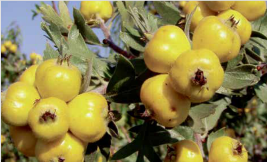
ALIÇ /HAWTHORN / HAWBERRY