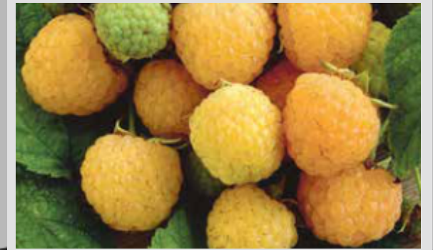
SARI AHUDUDU /YELLOW RASPBERRY