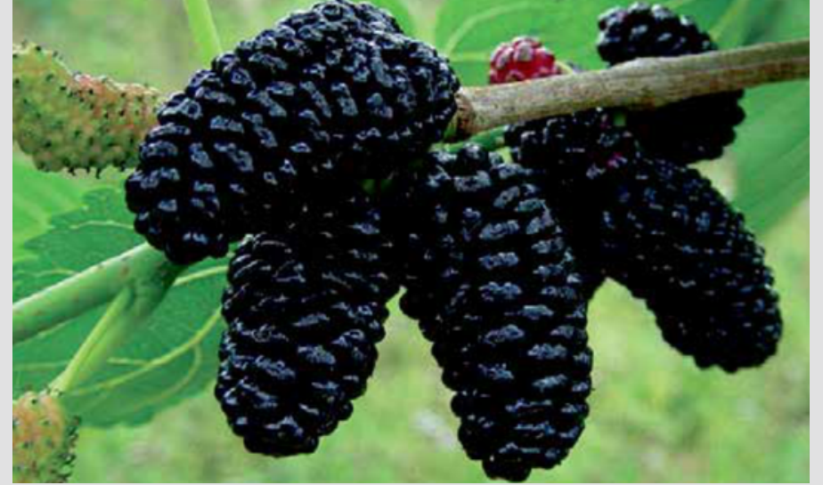
BODUR KARADUT /DWARF BLACK MULBERRY