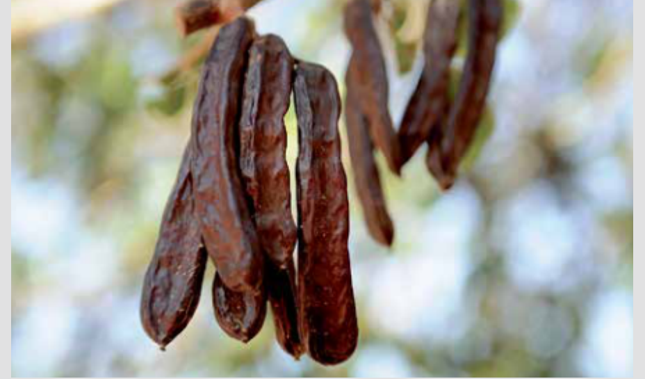
KEÇİ BOYNUZU /LOCUST BEAN / CAROB