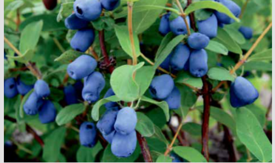
BAL YEMİŞİ /HASKAP