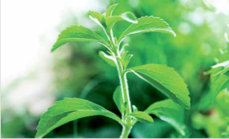
STEVIA / STEVIA

Stevia (Şeker otu) bitkisinin kökeni Brezilya, Arjantin ve Paraguay'dır. Günümüzde; Amerika, Çin, Japonya, Hindistan ve Güney Kore gibi birçok ülkede Stevia üretimi yapılmaktadır. Şeker Otunun başlıca üreticileri Paraguay, Brezilya, Japonya ve Çin'dir. Asteraceae familyasına aittir. Stevia bitkisinin yetişebilmesi için güneş ve yağmur en önemli unsurlardır. Suyu seven bir bitkidir, bulunduğu ekolojiye bağlı olarak yılda 2 ya da 3 kez hasat edilebilir. Stevia yerden 25-30 cm yüksekliğe ulaştığında gövdesinden kesilerek toplanır. 60-90 cm kadar boyolanmaktadır. Gövde ve yapraklar temizlenir. Stevia'nın tatlandırıcı etkisi, yapraklarındaki doğal özlerde (Rebadosid A) gizli. Bu özler sayesinde Stevia yaprakları şekerden 300 kat daha tatlıdır. Reb A (Rebadosid A) ayrıştırılmadan önce yapraklar, güneş veya sıcak hava kurutucuları yardımıyla kurutulur. Bu tatlı öz kalori içermediğinden insan vücudu tarafından emilmez.