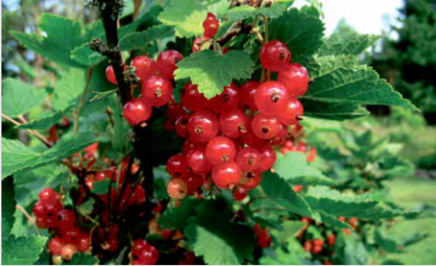
FRENK ÜZÜMÜ/CURRENT VARIETIE