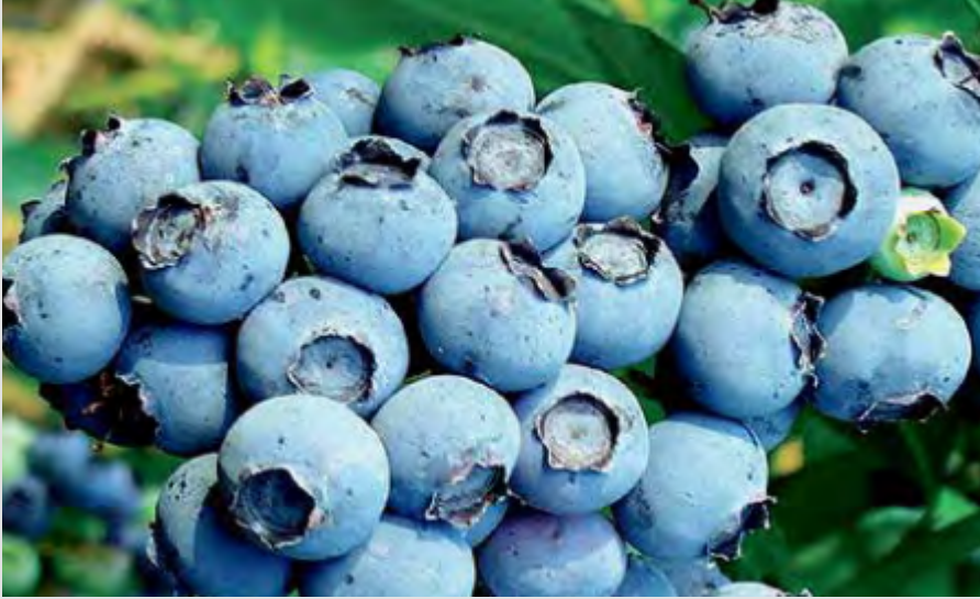
MAVİ YEMİŞ /BLUEBERRY