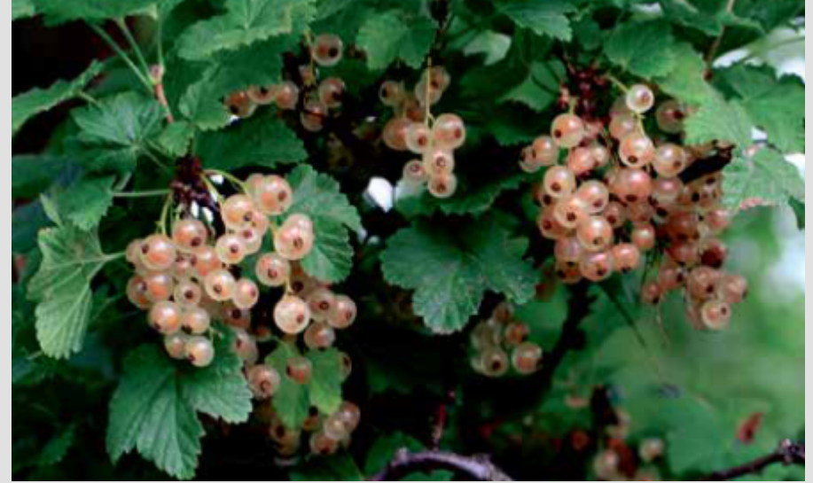
FRENK ÜZÜMÜ/CURRENT VARIETIE