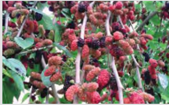
KARADUT / BLACK MULBERRY