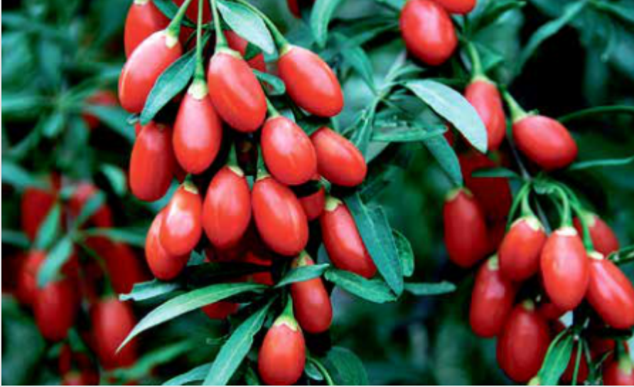
GOJİ BERRY / GOJIBEERY